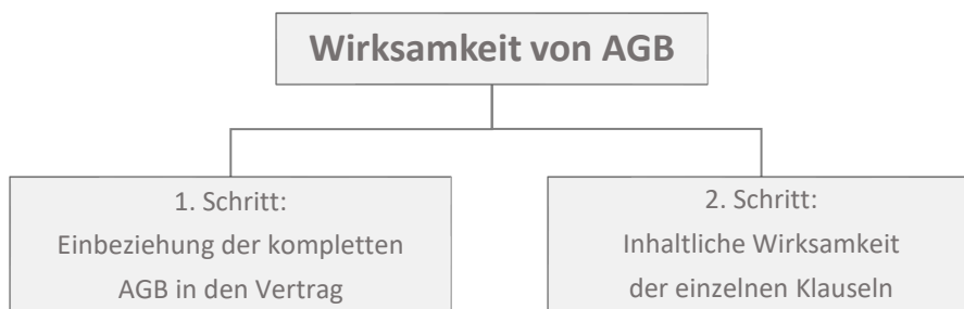
Abbildung 4.3: Wirksamkeit von AGB