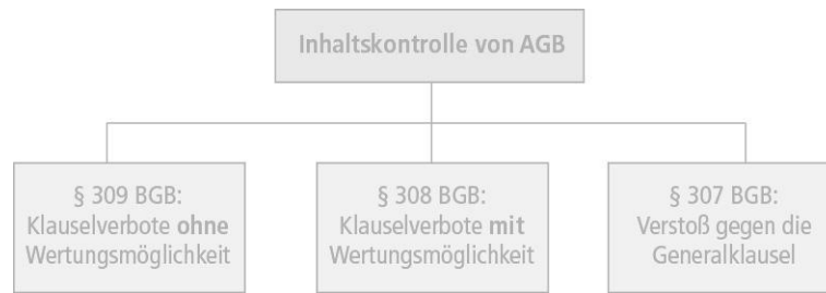
Abbildung 4.4: Inhaltskontrolle von AGB