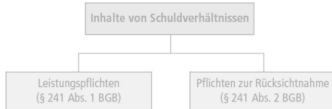
Abbildung 4.1: Inhalte von Schuldverhältnissen